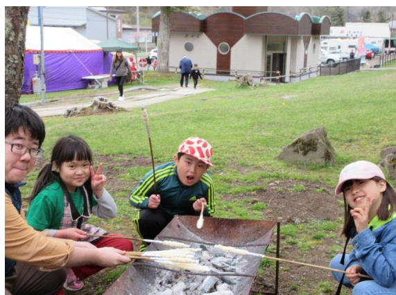
野焼きパン作り体験